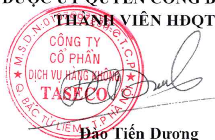
Đào Tiến Dương